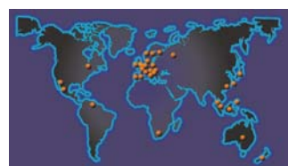
Sieć przedstawicielstw firmy HASCO na świecie